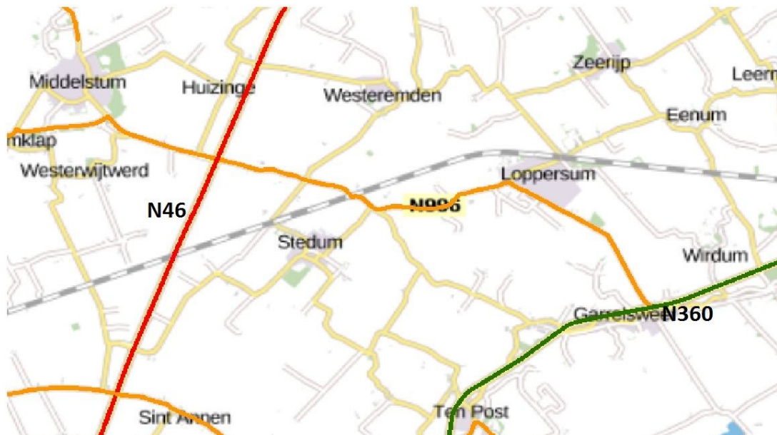
Onderhoud N996 tussen de N46 en de N360 m.u.v. bebouwde kom Loppersum

Dit is nodig om de kwaliteit van de weg te verbeteren, zodat de weg langer meegaat.